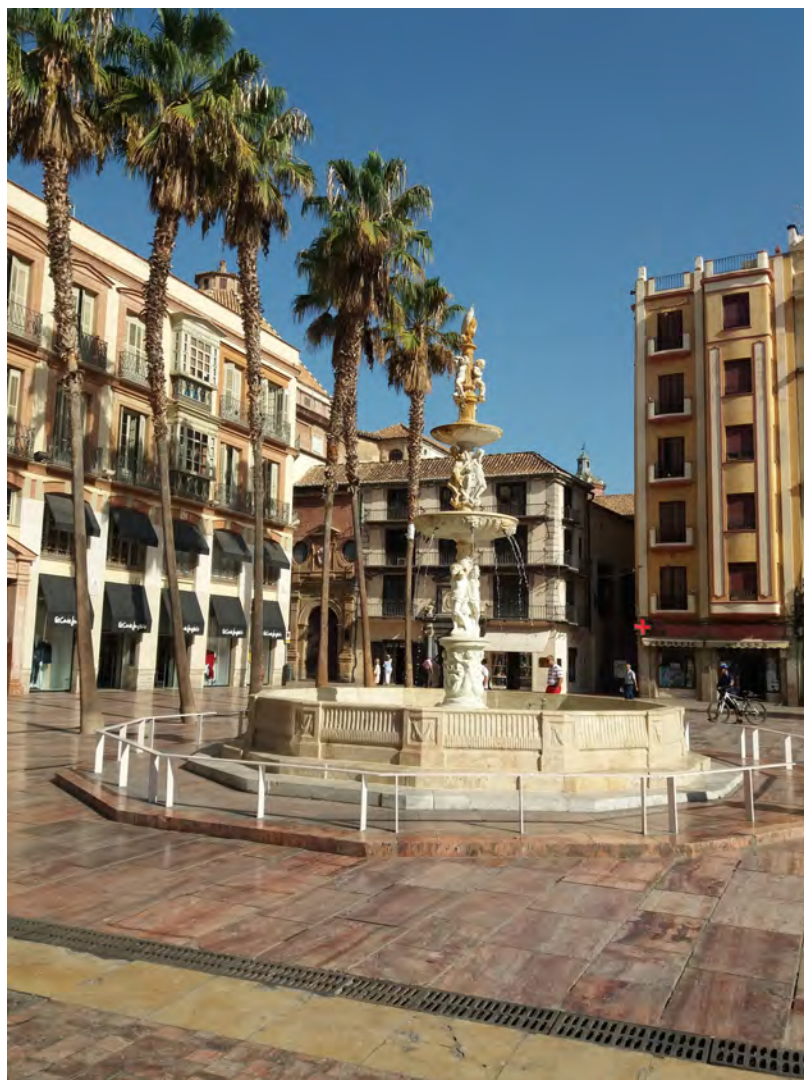
Figura 5. Fuente de Génova en la actualidad.