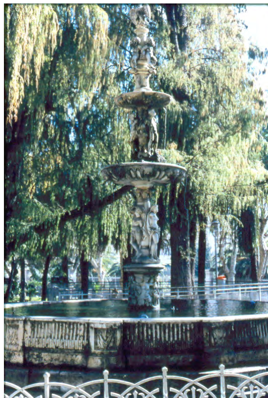
Figura 4. Fuente en el Parque, junto a los cisnes (1925-2003).

Glorieta del Parque (Fig. 4), junto al estanque con cisnes -de ahí su nueva denominación-, donde permaneció hasta el año 2003.