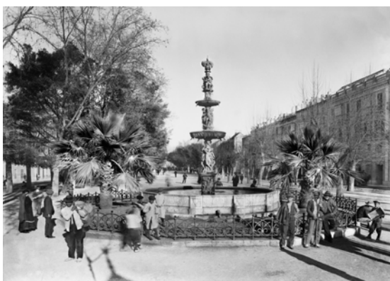
Figura 3. Fuente de Génova en la Alameda Principal (1906-1910).

A finales del XIX, surge un importante movimiento urbanístico en nuestra ciudad, es entonces cuando se proyecta una calle amplia y moderna que uniría la Plaza con la Alameda -la futura calle Marqués de Larios, inaugurada en 1891-; y es entonces cuando se desmonta la fuente y se instala en el extremo opuesto del Paseo, inmediato al Puente de Tetuán (Fig. 3).