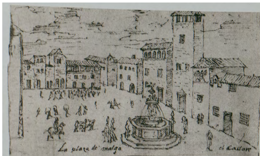
Figura 1. Plaza de Málaga de Anton Van der Wyngaerde, 1564, donde se observa la fuente frente a la cárcel pública.

Todas estas opiniones las recogió Medina Conde en sus Conversaciones Históricas Malagueñas , tomo III. Años después, el Padre Andrés Llordén nos da la referencia de que fue el escultor Giuseppe Micael Alfaro –nacido en Teruel–, quien realizó en 1635 obras en dicha fuente; no la construyó, sólo efectuó algunas modificaciones en sus elementos. Cuando