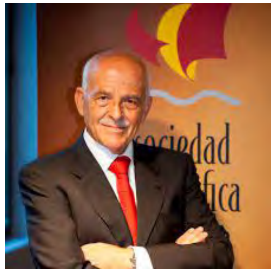
Portada del libro que recoge el programa del simposio.

geopermaseries de vegetación de Cádiz. Escala 1:250.000” .