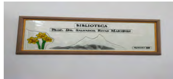
Placa situada a la entrada de la nueva biblioteca.

El acto final concluyó con la inauguración de la biblioteca "Salvador Rivas-Martínez", creada con sus fondos propios donados por la familia a la Universidad de León.