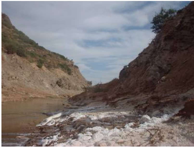
Manantial de Meliones