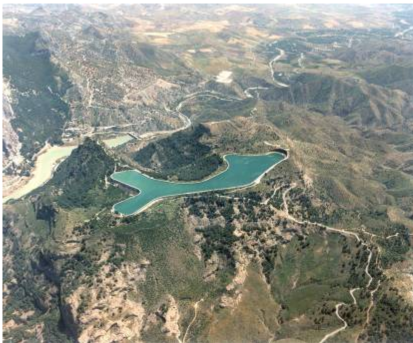
Embalse de la Encantada